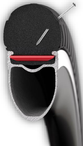
Tværsnit af det luftfrie cykeldæk

Helt sikkert. Det handler om at kendskabet til produktet bliver spredt ud i cykelmiljøet. Jeg vil helt klart anbefale det til mine medryttere, og jeg tror så snart flere og flere får det på deres cykle, så vil snakken imellem også gå stærkt. Udstyr er vigtigt for alle ryttere, om det er motion eller elite, og kan man optimere på sin cykel og træning så skal man gøre det. Jeg mener klart at de luftfrie Tannus dæk vil have en fremtid for landevejsrace.