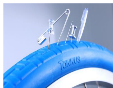
Tannus 100% punkterfrie løsning

Jeg tænker, at der med fordel kunne indgås et samarbejde mellem Team Rynkeby og TannusDenmark. Min klare holdning er, at hvis alle ryttere får Tannusdæk på fra starten af, så er der ingen som vil kunne mærke forskel, og det vil betyde så meget for den samlede tur og alle involverede parter. Uden punkteringer, ville det være langt nemmere for rytterne at komme ind i et kontinuerligt flow som er vigtigt, når man cykler langt. Vi har folk i Rynkeby