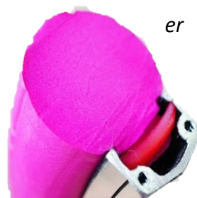
Massive cykeldæk – En løsning på punkteringsproblemet

Det er ofte lige, når vi kommer i gang og flowet kører, at der så kommer en ny punktering, hvor man venter og venter. Det er selvfølgelig en del af game-ten, men kunne